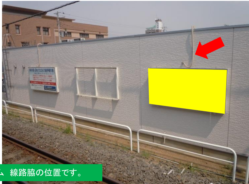
内房線・外房線下りホーム 線路脇の位置です。